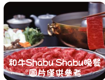
和牛Shabu Shabu晚餐 *圖片僅供參考