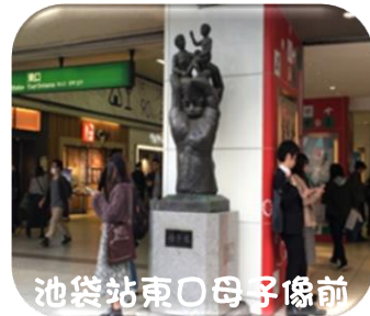
池袋站東口母子像前